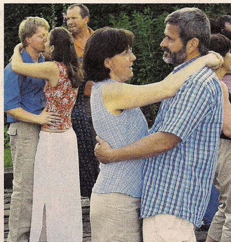
Tanec. Evangelický kněz se světské zábavy nezříká, třeba tance s manželkou.

za měřítko víry, učení i života. Sbory Církve bratrské vidí svůj úkol ve vyznávání křesťanské víry, ve vedení k ní, ve vytváření společenství věřících a především v praktické pomoci potřebným lidem.